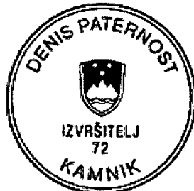
IZVRŠITELJ - Denis PATERNOST